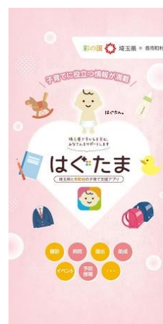
埼玉県子育て支援アプリ「はぐたま」

現在の子育ては、社会や地域との関わりが薄い中で、母親（父親）がときに孤独を感じながら子育てをしているといわれる。「ふかやきずなメール」ではその独自のコンテンツにより、妊娠期から切れ目なく子育て情報や親に寄り添うメッセージを届けることで育児不安をやわらげ、子育て家庭と地域の子育て支援資源をつなげていく。妊娠期から就学前年まで「切れ目ない子育て支援」を ICT で支える。